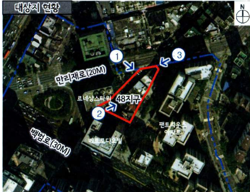
① 대지 북서측면