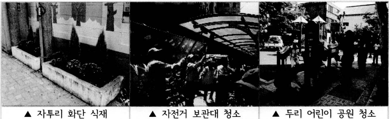
▲ 자투리 화단 식재