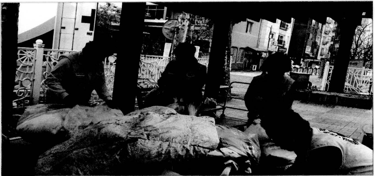
▲ 찾아가는 방문행정 - 빨래봉사