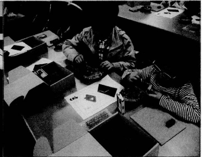
▲ 브리코 어린이 건축교실