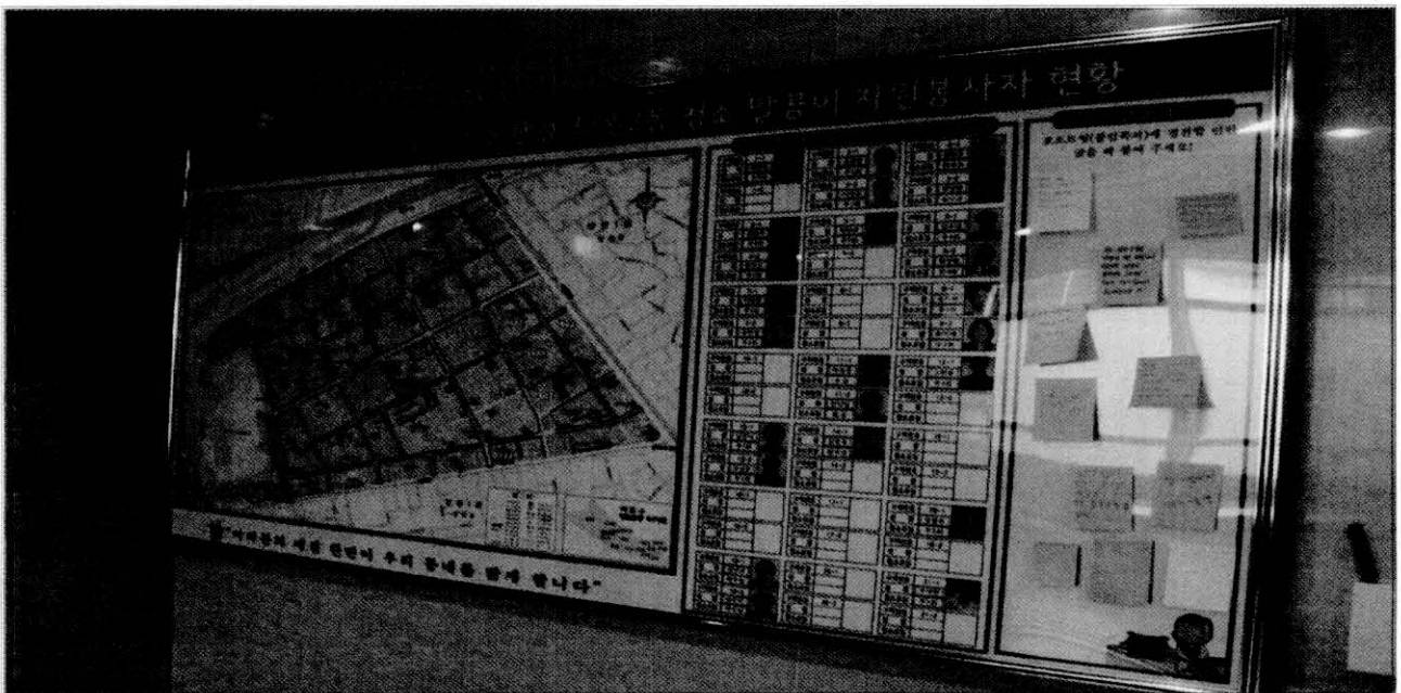
▲ 말끔이 봉사단 현황