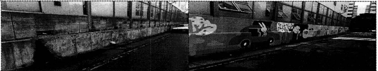
- 성산동589 전면