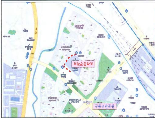
위치도 : 하늘초등학교 주변 보도