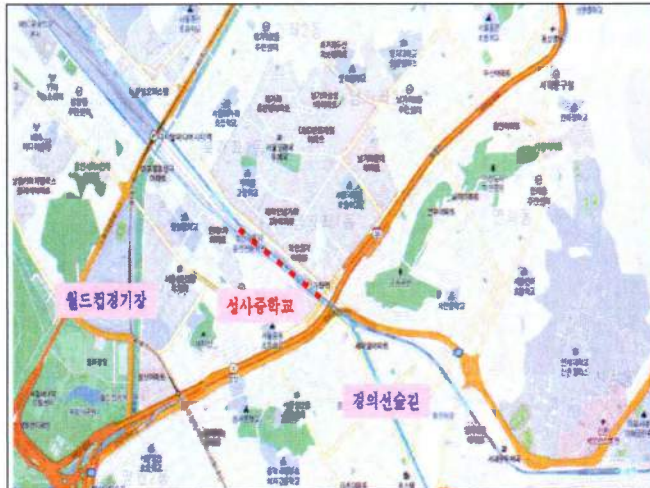
위치도 : 성사중학교 주변 보도