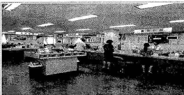
▶ 민원 발급 서비스