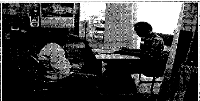
▶ 민원안내 도우미