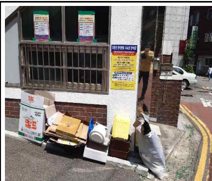
【무단투기 금지 경고판 정비】