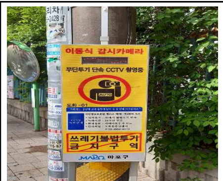
【이동형 CCTV 순환배치】