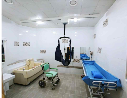
< 가족탕 >