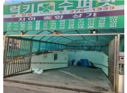
< (휠체어)장애인 경사로 >