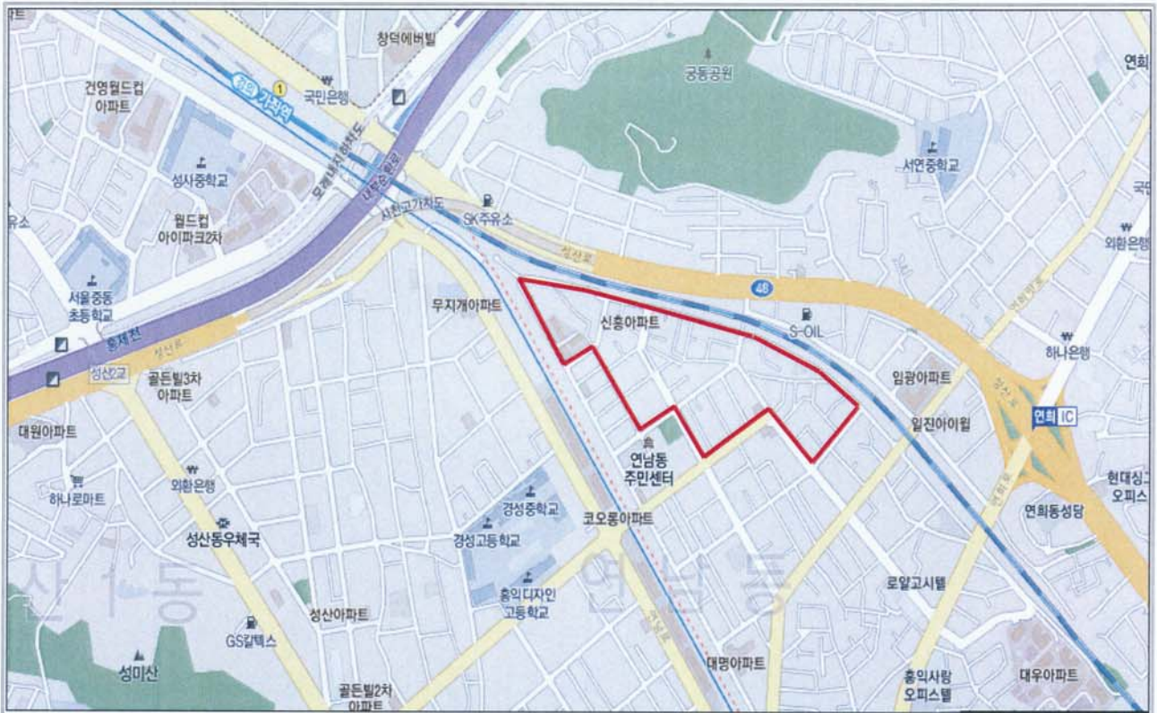
(4) 정비계획(구역) 결정도