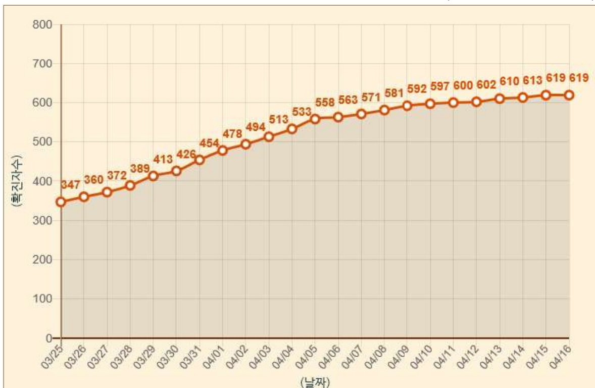
<표.1 서울시 누진 확진자 추이(기간 : 2020.3.25~4.16)> 6)