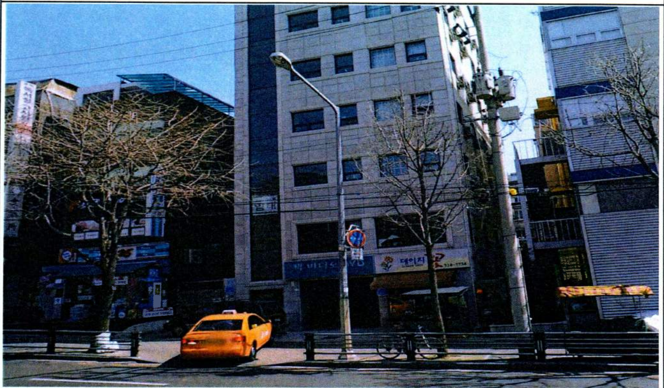
현황 사진(노후 가로등)