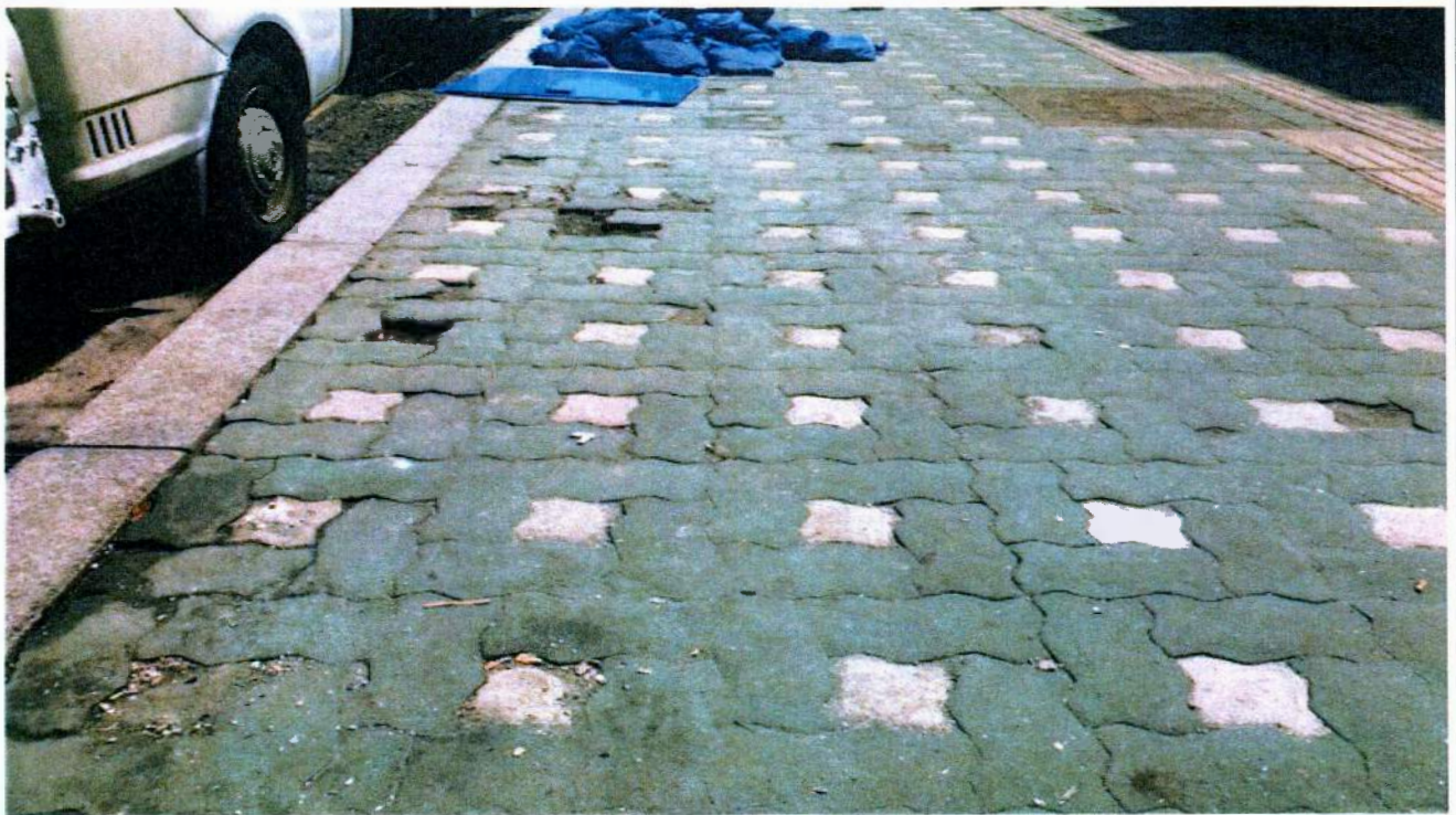
현 황 사 진