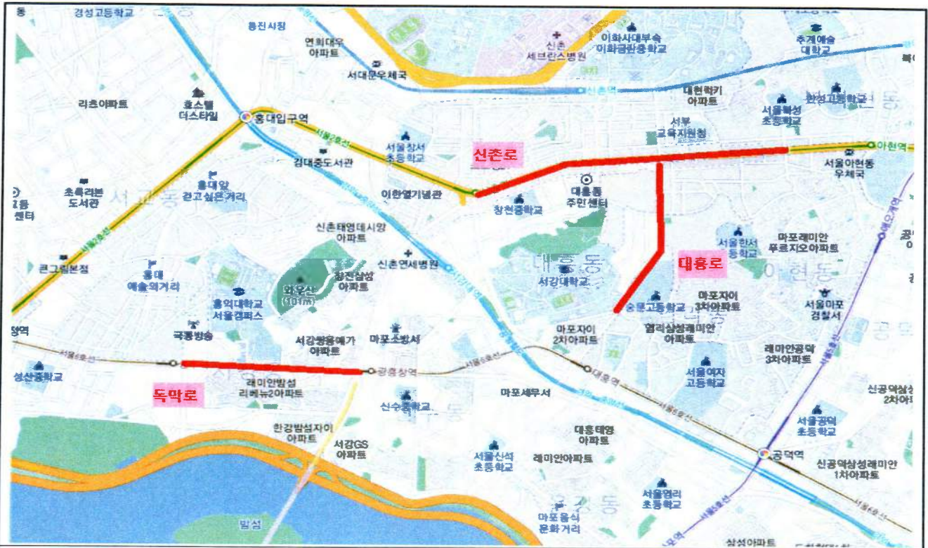
위 치 도