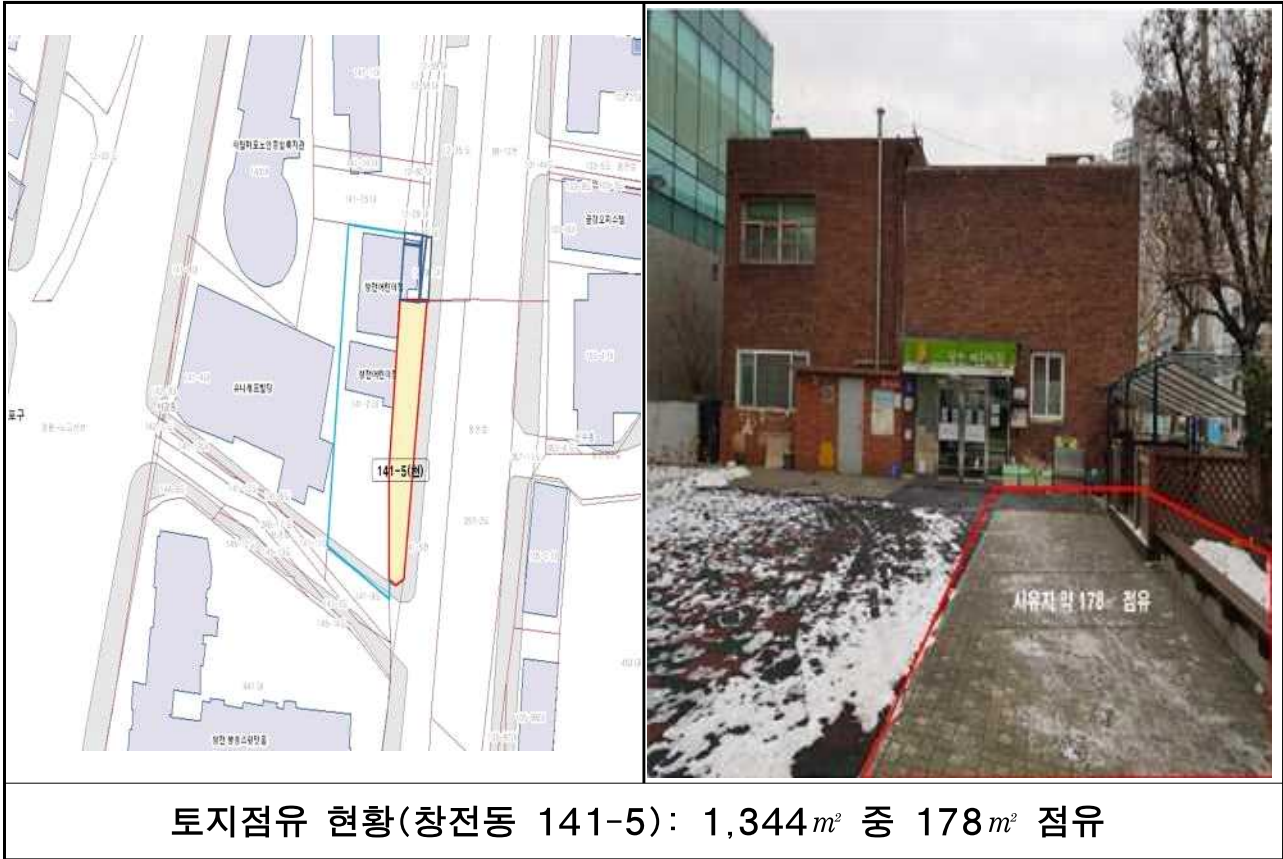
토지점유 현황(창전동 141-5): 1,344㎡ 중 178㎡ 점유