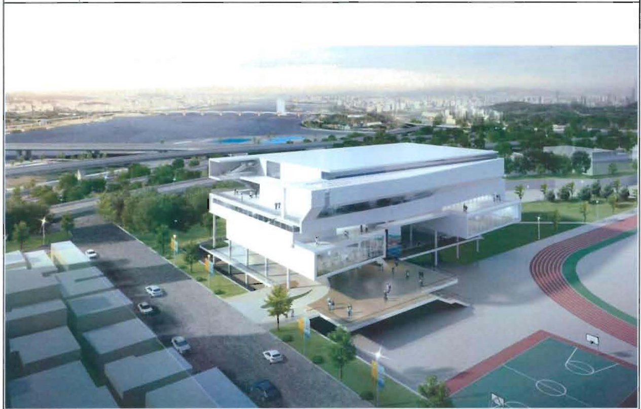
사진설명 조 감 도