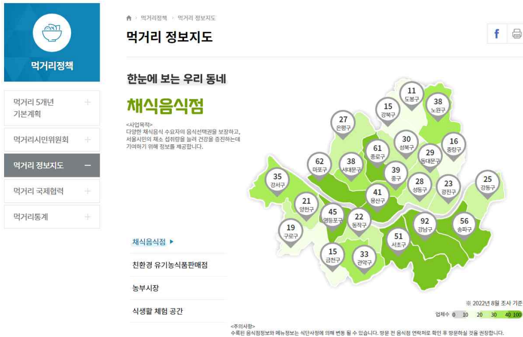
<그림 2. 서울특별시 식품안전정보 먹거리 정보지도(채식음식점)>

하고 있음. 조례 제정 후 더 많은 홍보 콘텐츠 개발로 홍보에 만전을 기 하여야 하겠음.