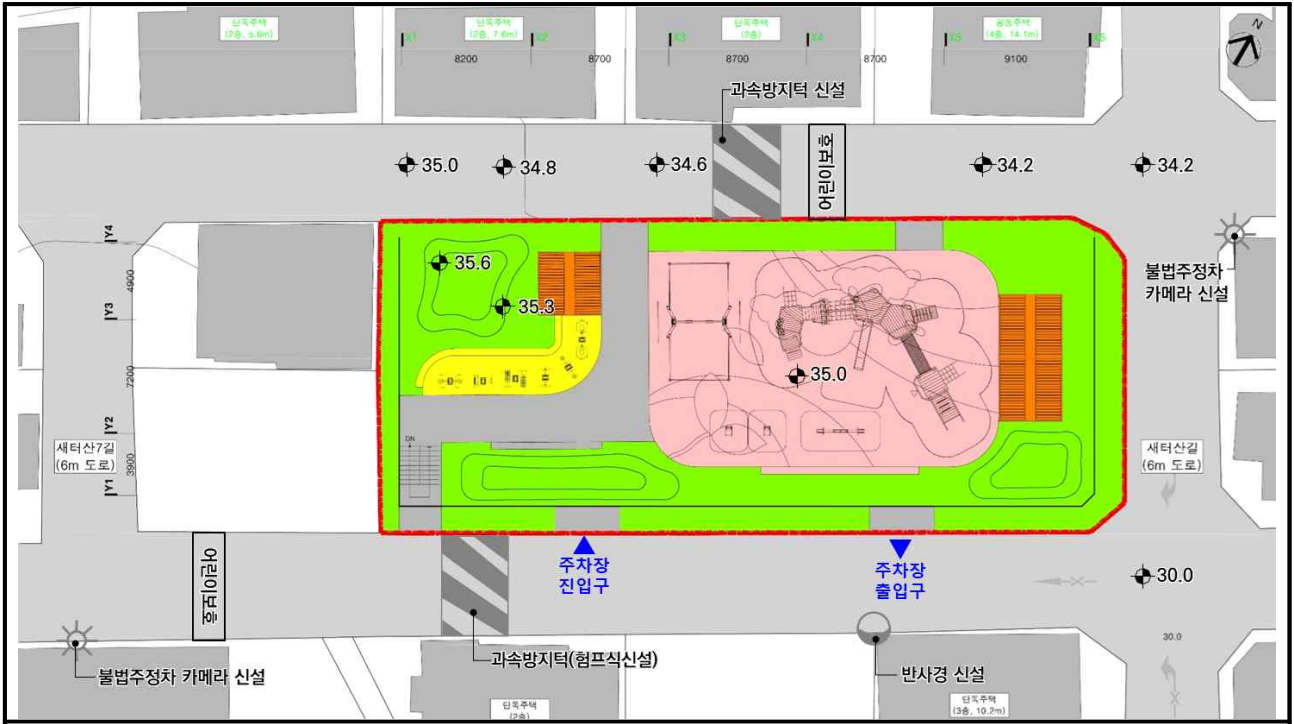
지상1층 공원 배치도