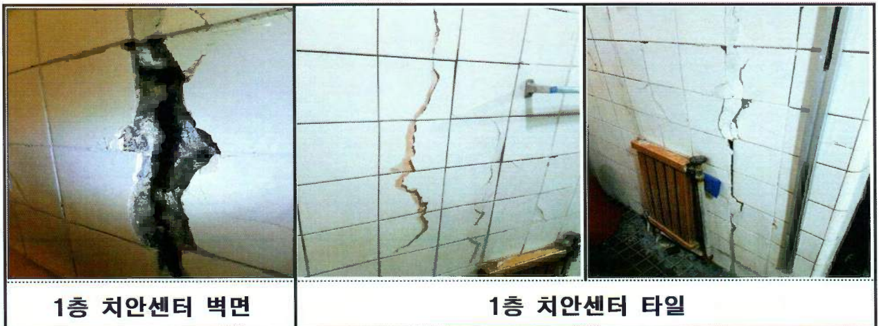
1층 치안센터 벽면