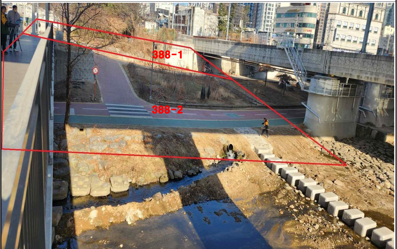
처분대상 구유지 중동 388-1, 388-2