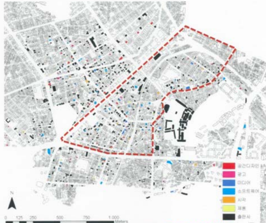
• 진흥지구 내 디자인관련 업체 현황 (참조:대안검토)