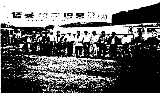
▶ 참여 인사 테이프 컷팅