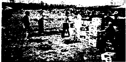
모종 옮겨 심기 ▶