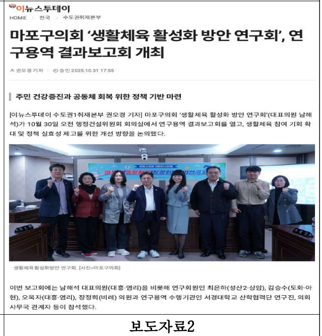
- 11 -